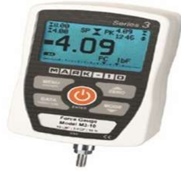
جهاز EK3-200 الالكتروني لقياس القوة العضلية