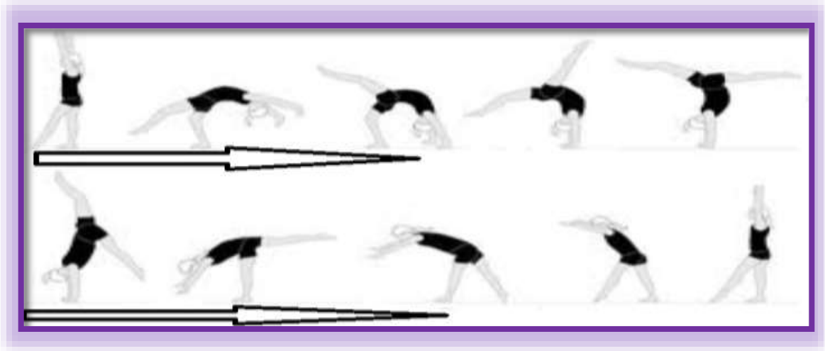
شكل (1) يوضح تسلسل مهارة القوس الخلفي